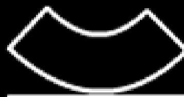
RESIST. A LA FLEXIÓN