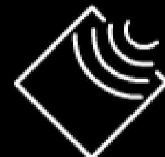
RESIST. AL CHOQUE TÉRMICO