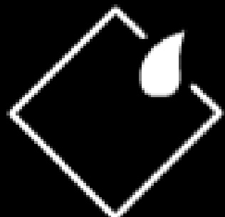
ABSORCIÓN DE AGUA