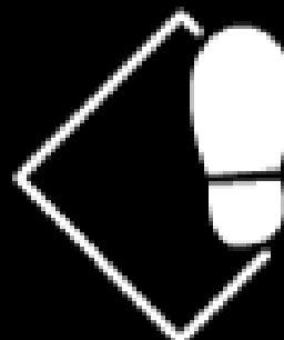
RESIST. A LA ABRASIÓN