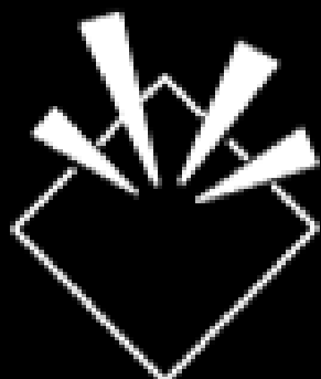
RESIST. AL IMPACTO